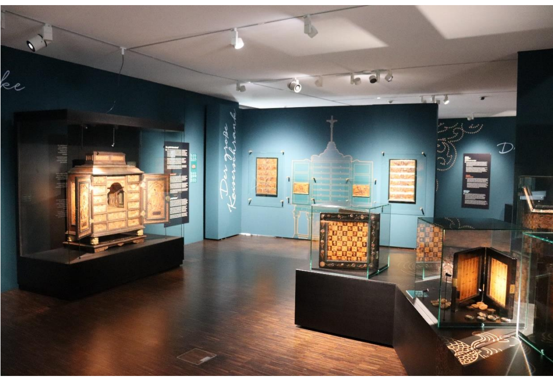
Foto: Prächtige Kabinettschränke, kunstvolle Schmuckschatullen, beeindruckende Brettspiele. Das Sudetendeutsche Museum präsentiert ein einzigartiges, faszinierendes Kunsthandwerk der Barockzeit.