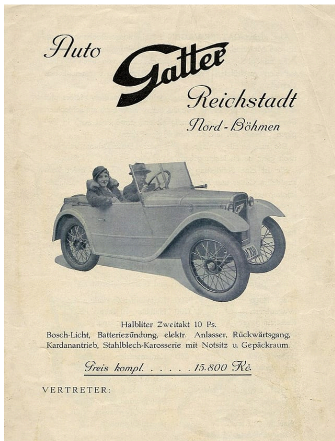
Propagační plakát automobilky Gatter (1934)

Gatterovi odběratele. Automobilka v roce 1936 zavřela a Willibald Gatter odešel do Německa.