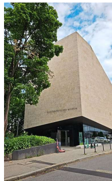
Mondäne Moderne: Das Sudetendeutsche Museum. my