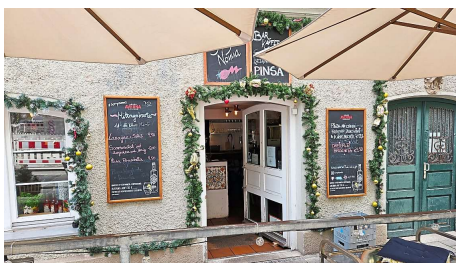
Pinsa und Panini: So richtig italienisch geht es bei Sorry Nonna ganz am Anfang der Lilienstraße zu. my