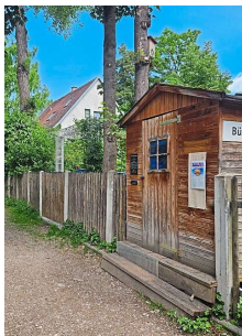
Ein Gartenhäusl? Nein, das ist der öffentliche Bücherschrank. my

Und in der Sammtstraße zweigt ein kleiner Fußweg ab – hier steht recht versteckt der öf-