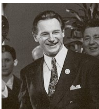
Hollywoodreife Geschichte: Liam Neeson spielte im Jahr 1993 in Steven Spielbergs Film Oskar Schindler.