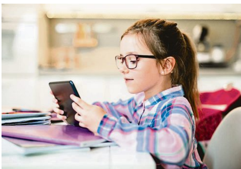
Schon die Kleinen sollten lernen, mit Medien und digitalen Inhalten umzugehen.