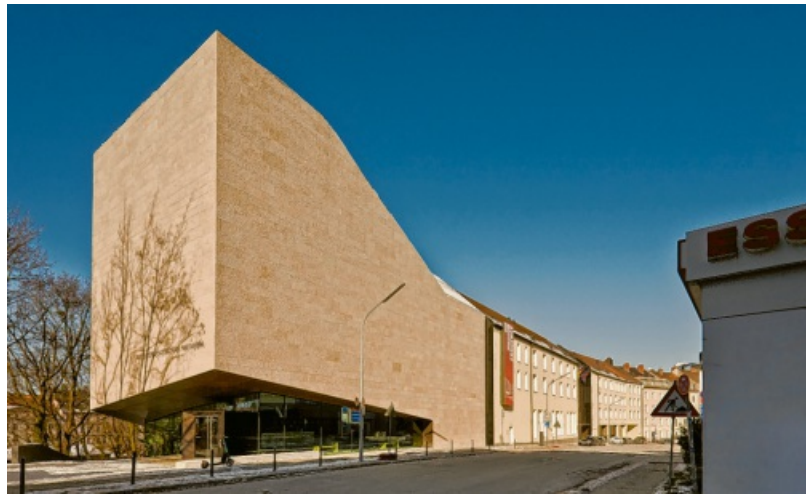
Von links oben im Uhrzeigersinn: Kurator Raimund Paleczek führt Charlotte Knobloch durch die Sonderausstellung. Porträtbild von Oskar Schindler aus dem Jahr 1957. Kernpunkt der Exposition: Die erstmals öffentlich gezeigte Liste der von Schindler angeforderten und geretteten jüdischen Häftlinge aus dem KZ Golleschau. Kühne Architektur: das 2020 eröffnete Sudetendeutsche Landesmuseum München.

Schindler ebenfalls aufnahm und so vor dem sicheren Tod bewahrte.